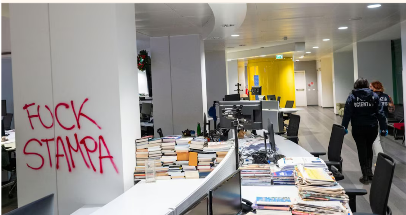
Una veduta interna della redazione di Torino del quotidiano La Stampa dove un centinaio di manifestanti ha fatto irruzione in un giorno in cui la sede era vuota.